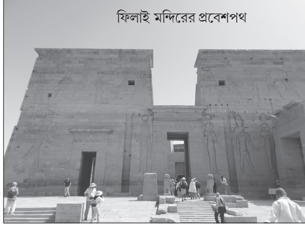
ফিলাই মন্দিরের প্রবেশপথ

১৯৬০ সালে আসওয়ানে নীলনদের ওপরে বাঁধ নির্মাণ হয়। বাঁধের জলাধারের তলায় তলিয়ে যায় ফিলাই এবং আবু সিম্বেল মন্দির। পরে ইউনেস্কো ফিলাই মন্দির এবং আবু সিম্বেলকে বাঁচাতে আন্তর্জাতিক প্রচেষ্টা শুরু করে। পাথরের