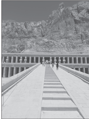
রানি হ্যাটশেপসুটের সমাধিমন্দির

সূর্যোদয়ের সময় উত্তরের মূর্তিটি থেকে বংশীধ্বনির মতন শব্দ শোনা যেত যার