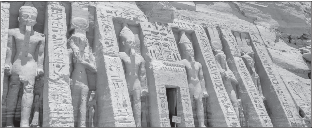
আবু সিম্বেল মন্দির

এডফু মন্দির : দেবতা হোরাসকে উৎসর্গীকৃত, নীলনদের পশ্চিমে একটি পাহাড়ে অবস্থিত এডফুর মন্দিরটি প্রাচীন মন্দিরগুলির মধ্যে সর্বোত্তম সংরক্ষিত ও অপরিবর্তিত। ২৩৭ ও ৫৭ খ্রিস্ট-পূর্বাব্দের মধ্যে গ্রিক রাজাদের সময় নির্মিত হয় এটি। দু-হাজার বছর ধরে মন্দিরের কাঠামো প্রায় চল্লিশ ফুট গভীর মরুভূমির বালি এবং নীলনদের পলির নিচে চাপা পড়েছিল। এর ফলে মন্দিরটি