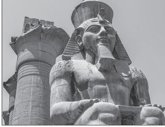
দ্বিতীয় রামেসিস-এর মূর্তি

হ্যাটশেপসুটের মন্দিরটি পরবর্তী সময়ে বিকৃত ও ভাঙচুর করা হয়েছিল। তাঁর সৎপুত্র এবং ভাগ্নে তৃতীয়