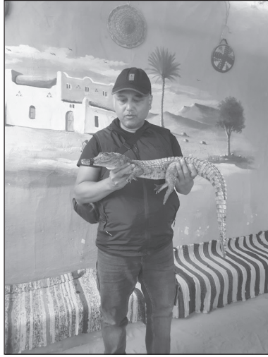
কুমির-ছানা হাতে লেখক

আসওয়ান শহরের কাছাকাছি এসে গিয়েছি। পাড়ে এক গরিমাময় হোটেল, ‘ওল্ড ক্যাটারাক্ট’। এখানে বসেই আগাথা ক্রিস্টি লিখেছিলেন রহস্য উপন্যাস ‘ডেথ অন দ্য নাইল’।