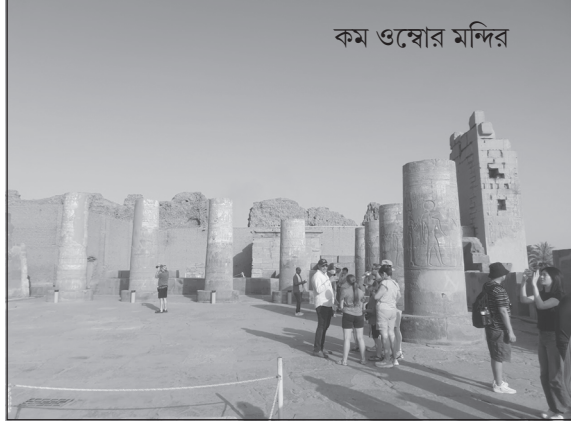
কম ওম্বোর মন্দির

যন্ত্রগুলির কোনও কোনওটি আজও ব্যবহৃত হয়।